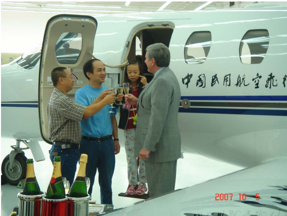
与中国客户在美国赛思纳飞机制造公司飞机交接仪式

随着中国经济的快速发展以及中美经贸关系的日益紧密，越来越多中国企业走向美国，在美国寻找发展壮大的机会。近 20 年来，中国民间与美国的关系越来越密切，许多中国家庭都有子女或亲戚在美国留学或移民，美国也几乎家家都在使用中国的产品。但是，中国企业民营企业有计划地走进美国应该说是刚刚开始，但它在今后 20 年内将会形成一股潮流而且产生十分深远的影响。企业走向国外远比出国留学移民或产品出口复杂得多。中国企业希望能比较顺利地进入美国，就需要了解很多新情况，学习很多新知识，建立许多新观念。